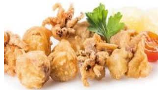
CHIPIRÓN CORTADO ENHARINADO Chipirón cortado enharinado CAR-05183 – 4kg/box