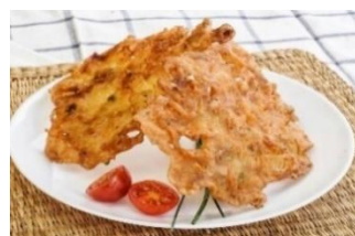
TORTILLITA DE CAMARÓN Tortillitas de camarón para freír congeladas CAR-09141 – 2kg/box