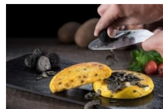
SPANISH BURGER TRUFA Tortilla rellena de queso de trufa para dorar en sartén o tortillero SEN-22015 - 180g - 18u/box