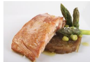
SALMÓN CONFITADO Salmón al aceite de limón y vainilla SRV-17301 - 190g - 12u/box