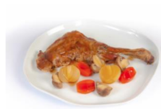
PALETILLA DE CABRITO Paletilla de Cabrito a baja temperatura LAR-31502 - 400g - 8u/box