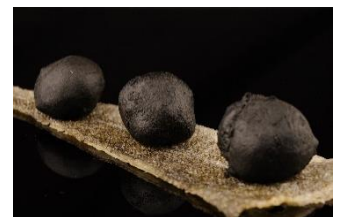
BUÑUELO DE BACALAO & ALIOLI Buñuelo negro de bacalao pre-frito relleno de bacalao con alioli EXQ-15155 - 15g - 50g/b - 100u/box