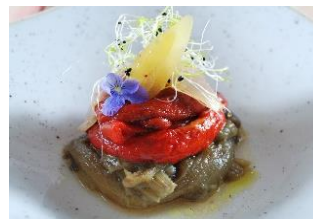
ESCALIVADA Pimiento, berenjena y cebolla escalibadas y peladas BIS-16000 - 1000g - 10u/box