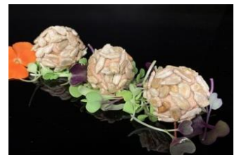
BOMBÓN DE FOIE Y PIPAS Bombón de foie recubierto de pipas caramelizadas. EXQ-15102 - 10g - 48u/b - 240u/b