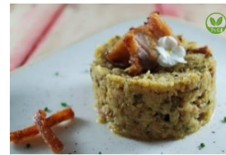
TRINXAT DE LA Cerdanya Trinxat de patata y col con panceta ahumada BIS-16031 - 300g - 20u/box