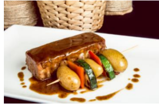
COSTILLA DE TERNERA DESHUESADA LINGOTE Costilla de ternera confitada y demigada BIS-17030 - 170g - 24u/box