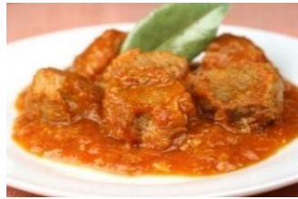
CARNE CON TOMATE Carne de cerdo con sofrito de tomate. BIS-16215 - 250g - 20u/box