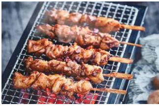
PINCHO POLLO YAKITORI Pincho de Pollo marinado con soja COT-10004 - 40g - 40u/box