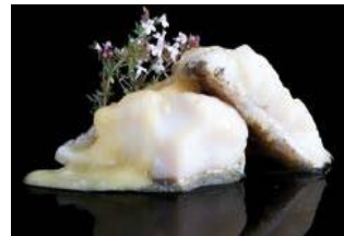
BACALAO AL PIL PIL Bacalao con salsa pil pil EXQ-17113 - 240g - 8u/box