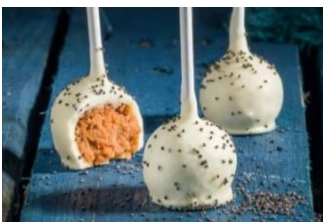
CAKE POP INVERTIDO SOBRASADA Cake Pop invertido de sobrasada ibérica recubierto de chocolate blanco. COC-09026 - 14g - 30u/b - 240u/b