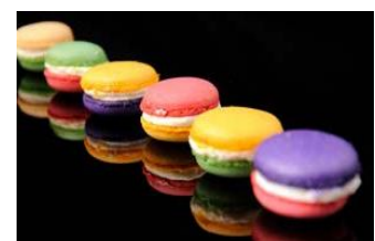
MACARON QUESO IDIAZABAL Macaron relleno de crema de queso idiazábal. EXQ-15166 - 10g - 48u/b - 144u/b