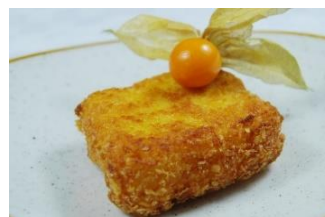
LECHE FRITA Crujiente y aromática leche frita rebozada con parko. BIS-40000 – 100g – 84u/box