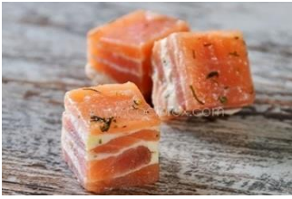
MILHOJITA DE SALMÓN & QUESO Mini milhoja de salmón ahumado, queso y eneldo COC-09019 - 8g - 100u/b - 800u/b