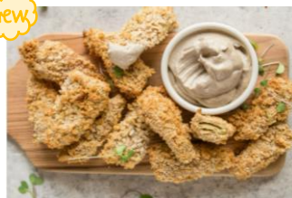
ALCACHOFAS REBOZADAS Cuartos de corazones de alcachofa confitada y rebozada con panko BIS-15035 1000g - 5u/box