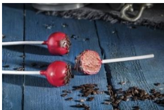
CAKE POP VELVET Cake pop Velvet con glaseado de chocolate sabor fresa. COC-14042 – 14g – 30u/b – 240u/box