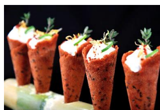
CONO CABRA & TOMATE Cono de pasta brisa relleno de queso de cabra y confitura de tomate. EXQ-15183 - 15g - 45u/b - 180u/b