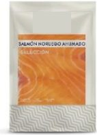
SALMÓN AHUMADO SOBRE Salmón ahumado precortado 100g SAL-A011 - 6u/box