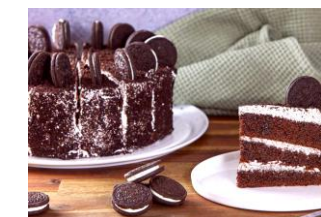
OREO Bizcocho de cacao rojo con mermelada de frutas del bosque y crema de queso, decorado con bizcocho rojo. DES-80586 – 1700g – 1u/box