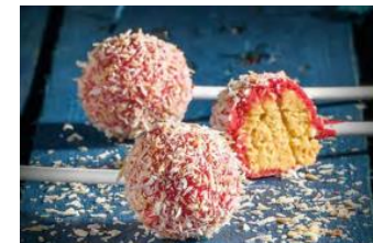
CAKE POP DE POLLO TIKA MASALA Cake Pop de pollo al curry recubierto de chocolate blanco y coco. COC-14075 - 14g - 30u/b - 240u/b