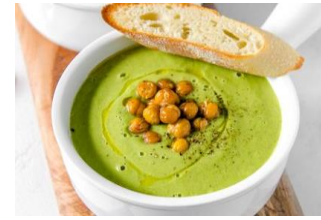
CREMA DE GUISANTES Crema de guisantes BIS-16021 - 250g - 20u/box