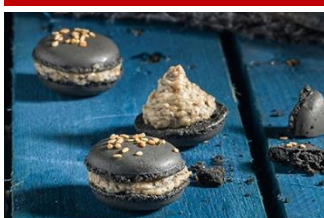
MACARON BOLETUS Macaron negro relleno de crema de boletus. COC-09102 - 8g - 48u/b - 288u/b