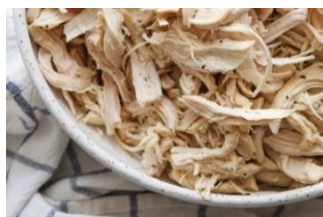
PULLED CHICKEN / POLLO Pechuga de pollo desmigada BIS-11070 - 1000g - 6u/box