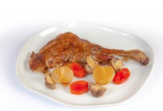
PALETILLA LECHAZO CONFITADO Paletilla lechazo confitado ABT LAR-11502 - 500g - 8u/box