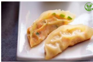
GYOZA VERDURAS Empanadilla japonesa pre-marcada rellena de verduras COT-17002 - 20g - 50u/b - 500u/b