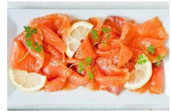
SALMÓN AHUMADO EN ACEITE Salmón ahumado precortado en aceite SAL-A102 - 700g - 2u/box