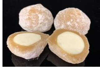
MOCHI DE QUESO DE OVEJA Mochi de arroz glutinoso relleno de queso EXQ-15211 - 20g - 48u/b - 144u/b