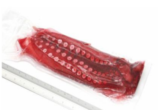
PULPO COCIDO Pulpo cocido en su jugo 2PG - 400/500g - POP-22023 2PM - 300g/400g - POP-22010