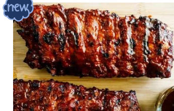
TIRA DE COSTILLA CERDO Tira de costilla a baja temperatura Pork Ribs. BIS-16135 - 400g - 20u/box