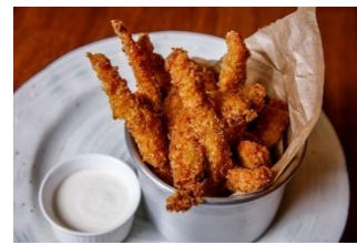
FINGERS DE POLLO CON PANKO Carne de Pollo marinada y rebozada en panko BIS-12020 - 1000g - 5b/box