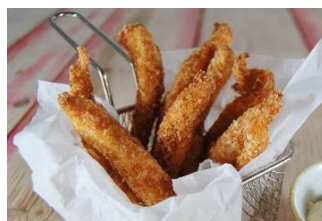
CHICKEN TENDERS CON PANKO Pechuga de Pollo marinada y rebozada en panko BIS-12015 - 1000g - 5b/box