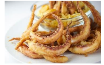
REJOS DE POTA Rejos de pota enharinados listos para freír y servir CAR-05300 – 3kg/box