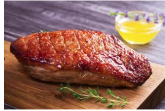
MAGRET DE PATO Pechuga de pato fresca envasada al vacío. KAT-000M - 400/500g - 4u/b