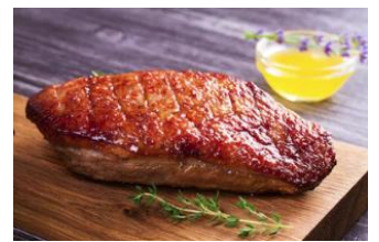
MAGRET DE PATO Pechuga de pato fresca envasada al vacío. KAT-000M – 500g – 4u/b