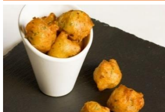
BUÑUELO DE BACALAO Buñuelo de bacalao pre-frito PAI-00286 - 20g - 1000g/b - 6b/box