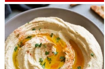
HUMMUS CLASICO Hummus de garbanzos. BIS-70182 - 1000g - 7u/box