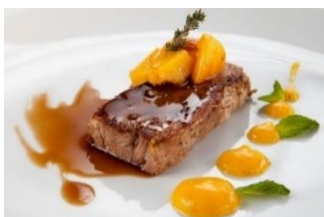
CORDERO DESHUESADO Cordero deshuesado confitado ABT LINGOTE: BIS-17105 - 170g - 24u/box PLACA: BIS-17106 - 2kg - 3u/box