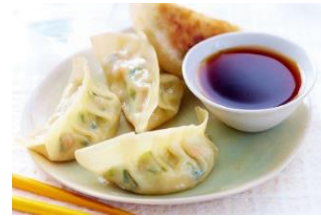
GYOZA POLLO Empanadilla japonesa pre-marcada rellena de pollo con verduras COT-17001 - 20g - 50u/b - 500u/b