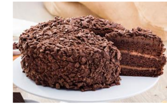
MUERTE POR CHOCOLATE Bizcocho de chocolate relleno de crema de chocolate, decorado con chocolate granulado. DES-80313 – 1700g – 1u/box