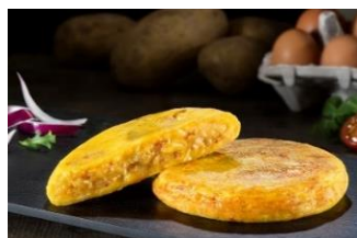
BURGER CON CEBOLLA Tortilla individual con cebolla para dorar en sartén o tortillero SEN-22010 - 180g - 18u/box