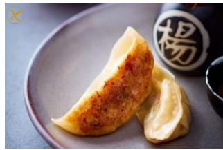
GYOZA GAMBAS Empanadilla japonesa pre-marcada rellena de gambas y verduras COT-17003 - 20g - 50u/b - 500u/b