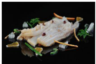
ESCABECHE DE RAYA Raya macerada con limón, para servir fría, tibia o caliente. EXQ-29024 - 250g - 8u/box