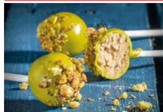
CAKE POP DE FOIE & MANZANA Cake Pop de foie y manzana recubierto de chocolate verde y pistachos. COC-14074 - 14g - 30u/b - 240u/b