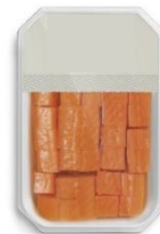
SALMÓN AHUMADO DADOS Salmón ahumado a dados en aceite SAL-A103 - 700g - 2u/box