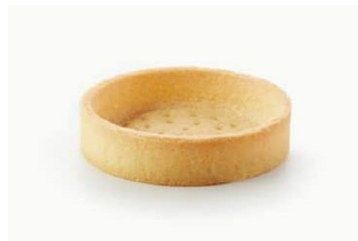
TARTELETA DULCE RECTA 70mm Tartaleta dulce de pasta brisa elaborada con mantequilla de 18x70mm. MAS-DIS282 – 70mm – 96u/box