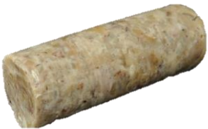
RULO MANITAS DE CERDO Rulo de manitas de cerdo para corte BIS-14305 - 1000g - 4u/box