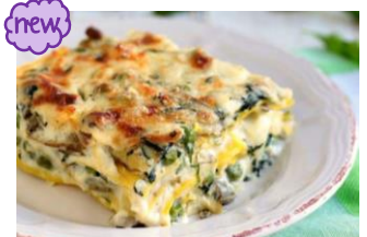
LASAÑA DE VERDURAS Lasaña rellena de verduras y bechamel BIS-14312 - 300g - 12u/box