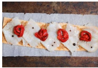
BACALAO AHUMADO EN ACEITE Bacalao ahumado precortado en aceite SAL-A122 - 700g - 2u/box