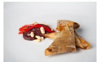
TRIÁNGULO MORCILLA Brick relleno de morcilla EXQ-15019 - 15g - 30u/b - 180u/box