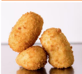
CROQUETA GAMBA Croqueta cremosa de gamba con trocitos de gamba. BIS-10200 - 35g - 30u/b - 240u/b CROQUETA CALÇOTS Croqueta cremosa de calçots. BIS-10215 - 35g - 30u/b - 240u/box CROQUETA PARMESANO Croqueta cremosa de queso parmesano BIS-10210 - 35g - 30u/b - 240u/box