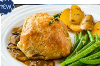
WELLINGTON DE CARRILLERA CERDO Hojaldre relleno de carrillera de cerdo al oporto con champiñones BIS-18101 - 150g - 20u/box