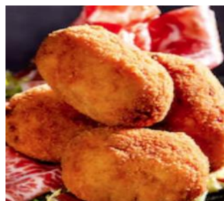
CROQUETAS RÚSTICAS JAMÓN IBÉRICO 20% GOR-27615 35g / 5kg/b COCIDO GOR-27625 / 40g / 5kg/b BACALAO GOR-27620 / 30g / 5kg/b ESPINACAS & QUESO GOR-27630 30g / 5kg/b PULPO GALLEGA GOR-27662 / 30g / 5kg/b BOLETUS (redonda) GOR-27640 25g / 5kg/b