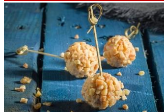
BROCHETA DE QUESO & HIGOS Brocheta de queso & higos recubierto de almendra. COC-09024 - 10g - 95u/b - 380u/b