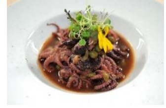
PULPITOS MARINERA Pulпитos con guisantes y salsa marinera BIS-16201 - 300g - 20u/box