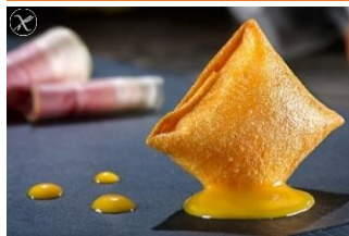
PINTXO DE HUEVO, PATATAS & BACON Pintxo de patata con yema de huevo y bacon SEN-15002 - 25g - 125u/b