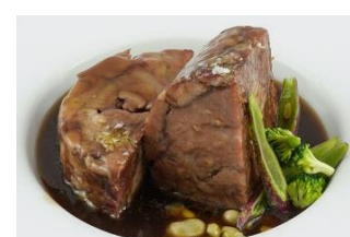
CARRILLERA DE CERDO MOLDEADA Carrillera de cerdo a baja temperatura BIS-17028 - 170g - 24u/box