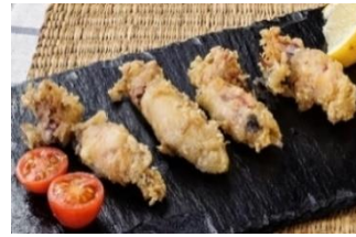
CHIPIRONES PUNTILLITAS Puntillitas enharinadas CAR-001071 – 4kg/box