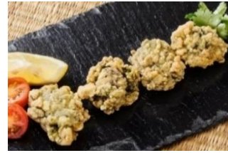
ORTIGUILLAS Ortiguillas enharinadas CAR-05094 – 2kg/box