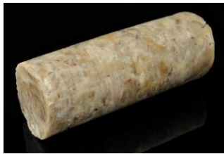
RULO MANITAS DE CERDO Rulo de manitas de cerdo para corte BIS-14305 - 1000g - 4u/box