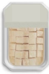
BACALAO AHUMADO DADOS Bacalao ahumado a dados en aceite SAL-A123 - 700g - 2u/box