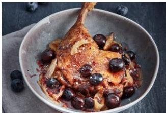
CONFIT DE PATO MUSLOS 8M 8 muslos de pato confitados en grasa de pato y sal. KAT-OMU8 – 4,3Kg – 3u/b