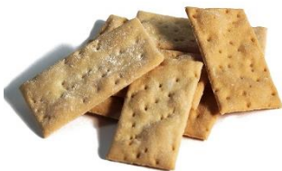
CRUJIENTE NEUTRO Pan crujiente de sabor neutro. Aguanta la humedad y permite rellenar. SOP-01020 - 600g - 8b/box