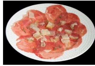
CARPACCIO DE BUEY Carpaccio cortado en láminas EXQ-17079 - 70g - 20u/box