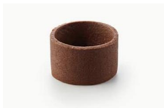
MINI TARTELETA DULCE RECTA CACAO 38mm Tartaleta dulce de pasta brisa elaborada con mantequilla y cacao de 20x38mm. MAS-DIS402 – 38mm – 192u/box