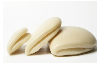
PAN BAO MINI Pan bao de textura tierna y esponjosa para acabar al vapor y rellenar. ATC-16300 - 15g - 50b - 250u/box