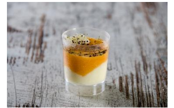
VASITO MOUSSE DE BACALAO Vasito de mousse de bacalao porrusalda y vizcaína con cebollino. COC-02019 - 35g - 42u/b - 126u/box