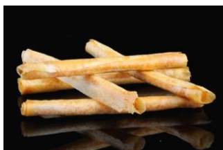
CIGARRILLO HUEVOS & CHISTORRA Brick relleno de huevos fritos con chistorra EXQ-15022 - 12g - 30u/b - 180u/box