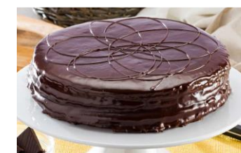
SACHER Bizcocho de chocolate relleno de mermelada de albaricoque y cobertura de chocolate negro. DES-80101 – 1200g – 1u/box