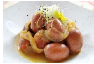
CHORICITOS A LA SIDRA Choricitos a la sidra con cebolla BIS-16051 - 250g - 20u/box