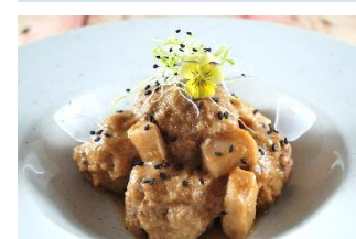
ALBÓNDIGAS MIXTAS CON SEPIA Albóndiga mixta con salsa de sepia, trozos de sepia y guisantes BIS-16105 - 300g - 20u/box