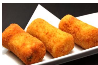
CROQUETÓN JAMÓN Croquetón de jamón GOR-27603 - 80g - 12u/Kg - 5Kg/box