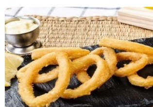
ANILLAS DE CALAMAR (POTA) Anillas de pota enharinadas CAR-05163 - 4kg/box