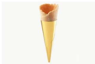
MINI CONO GALLETA Mini cono galleta anhidradura con 75x25mm MAS-DIS570 – 75mm – 180u/box