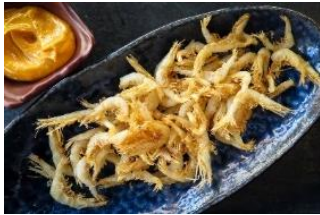
GAMBA CRISTAL ENHARINADA Gambita cristal/ blanca enharinadas CAR-02149 – 3kg/box