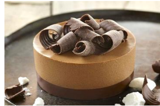
TRUFFON Ganache y mousse de chocolate 58% cacao, corazón de merengue francés y deco de chocolate negro. TEU-05563 – 85g – 16u/box