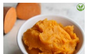
PURÉ MONIATO Puré de moniato dulce. BIS-30103 - 250g - 10u/box