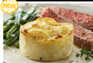
GRATÉN DE PATATA Gratinado suave y fundente de patata con leche y mozzarella TEU-00428 100g - 20u/box