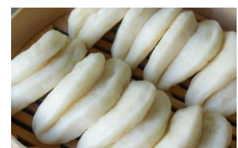
PAN BAO Pan bao de textura tierna y esponjosa para acabar al vapor y rellenar. TOK-16400 - 55g - 20u/b - 7b/box