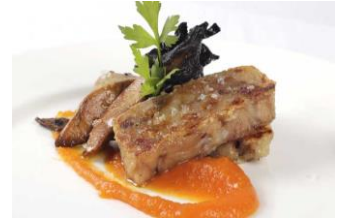
MANITAS CERDO DESHUESADAS Manitas ABT deshuesadas LINGOTE: BIS-17020 - 170g - 24u/box PLACA: BIS-17021 - 2000g - 3u/box