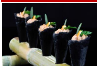
CONO DE FOIE & MANZANA Cono de pasta brisa relleno de mousse de foie. EXQ-15182 - 15g - 45u/b - 180u/b