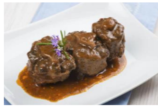
RABO DE TERNERA Rabo de ternera guisado con salsa de vino tinto y oporto BIS-16210 - 1000g - 6u/box