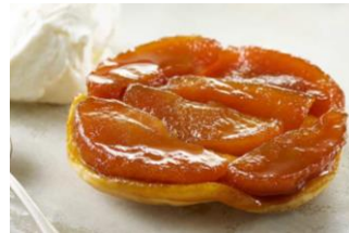
TATÍN DE MANZANA Masa quebrada de mantequilla y manzanas caramelizadas. R: 10min a 180°C / 1/1,30min a 750W TEU-06244 – 120g – 16u/box