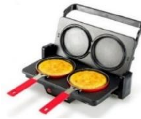
TORTILLERO GRILL Tortillero-Sandwichera con adaptadores y sartén para tortillas SEN-50000 - 1u/b