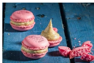
MACARON FOIE Macaron rosa relleno de mousse de foie. COC-09104 - 8g - 48u/b - 288u/b