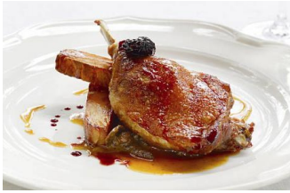
CONFIT DE PATO 8M 8 Muslos de pato confitados en grasa de pato KAT-0MU8 - 4,3Kg - 3u/b