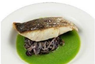
CORVINA CONFITADA Merluza confitada a baja temperatura SRV-17301 - 160/180g - 12u/box