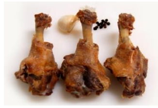
ALAS CONFITADAS DE PATO 12 alas de pato confitadas en grasa de pato y sal. KAT-OM12 – 4,3Kg – 3u/b