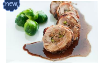
MUSLO POLLO DE SETAS & TRUFA Muslo de pollo relleno de setas y trufa a baja temperatura. BIS-11015 - 250g - 24u/box