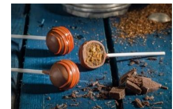
CAKE POP CARROT & NUECES Cake pop de tarta de zanahoria recubierto de chocolate con leche. COC-14070 – 14g – 30u/b – 240u/box