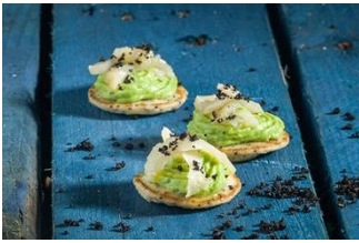
BLINI BACALAO & GUACAMOLE Mini blini de bacalao ahumado, aguacate y tierra de aceituna negra. COC-19010 - 7g - 24u/b - 240u/b