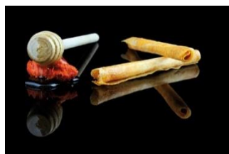
CIGARRILLOS SOBRASADA & MIEL Brick relleno de sobrasada con miel EXQ-15091 - 12g - 30u/b - 180u/box