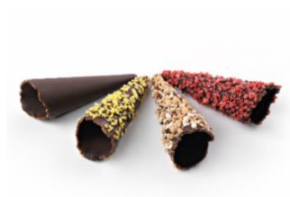
MINI CONO CACAO SURTIDO Mini cono cacao anhidradura de 75x25mm Cacao, Crocanti, Limón y Fresa MAS-DIS590 – 75mm – 180u/box