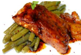
COSTILLAS DE CERDO IBÉRICO Costillas ABT confitadas CLASICAS: LAR-71530 - 300g PIMENTÓN: LAR-71531 - 300g -12u/box