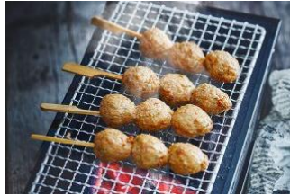
PINCHO TSUKUNÉ Bolas de pollo rebozadas marinadas COT-10010 - 40g - 40u/box