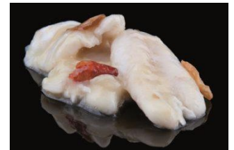
KOKOTXAS AL PIL PIL Kokotxas de bacalao con salsa pil pil EXQ-29132 - 240g - 8u/box