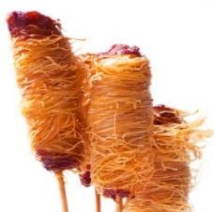
CAPRICO HISTORRA & KATAIFI Chistorra envuelta en pasta kataifi ATC-15514 - 22g - 50u/box