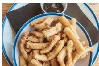
RABA CÁNTABRA Raba cántabra enharinada para freír congelada CAR-05238 – 2kg/box