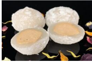
MOCHI DE FOIE Mochi de arroz glutinoso relleno de foie EXQ-15210 - 20g - 48u/b - 144u/b