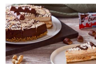
CHOCO KINDER Base de galletas empapadas en café rellena de chocolate blanco con avellanas, decorada con cacahuete y trocitos de Kinder. DES-80805 – 1900g – 1u/box