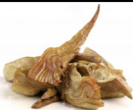
ALCACHOFA CONFITADA Cuartos de alcachofa confitados BIS-11900 – 190g – 20u/box