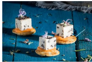
BLINI CABRA & MOUSSE TOMATE Mini blini de queso de cabra con aceitunas negras y mousse de tomate. COC-09023 - 7g - 24u/b - 240u/b