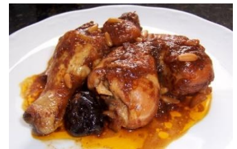
POLLO A LA CATALANA Pollo guisado con ciruelas y piñones BIS-16112 - 325g - 20u/box