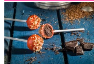
CAKE POP CHOCOLATE & NARANJA Cake pop de chocolate recubierto de chocolate con naranja. COC-14043 – 14g – 30u/b – 240u/box