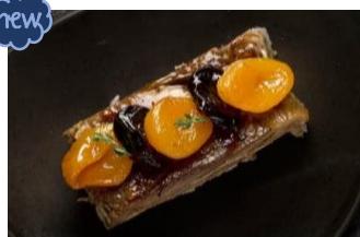
CABRITO DESHUESADO Cabrito deshuesado confitado ABT LINGOTE: BIS-17105 - 170g - 24u/box