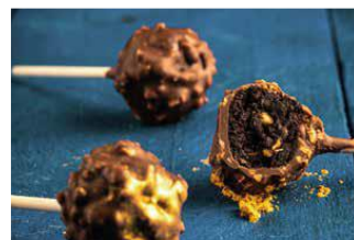
CAKE POP ROCHER Cake pop de rocher de chocolate con avellanas. COC-14085 – 14g – 30u/b – 240u/box