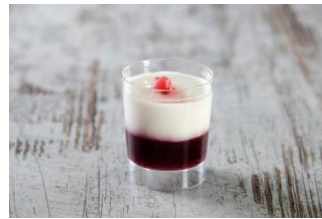
VASITO TORTA DEL CASAR Vasito de crema de Torta del Casar y mermelada de Frutos Rojos. COC-09035 - 35g - 42u/b - 126u/box