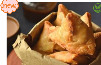
MINI SAMOSA INDIA Samosa mini rellena de patata, guisantes y especias indias. BIS-11530 - 20g - 140u/b