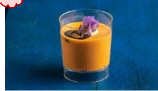
VASITO PASTEL DE CABRACHO Vasito mousse de pastel de cabracho con salsa de yogur y alcaparras. COC-09038 - 35g - 42u/b - 126u/box