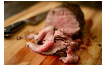
ROAST BEEF Roast Beef de ternera para cortar BIS-17024 - 2kg 4u/box