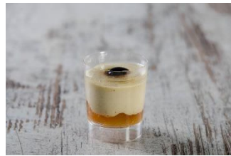
VASITO FOIE Vasito de mousse de foie, cebolla caramelizada y Módena. COC-09034 - 35g - 42u/b - 126u/box