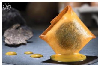
PINTXO DE HUEVO, PATATAS & TRUFA Pintxo de patata con yema de huevo y trufa SEN-15004 - 25g - 125u/b