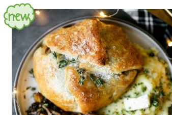
WELLINGTON SALMÓN Hojaldre relleno de salmón para hornear. BIS-18102 - 150g - 20u/box