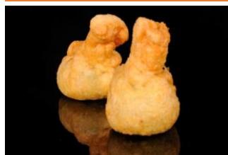
HOJALDRE CABRA & TOMATE Hojaldre relleno de queso de cabra y confitura de tomate. EXQ-15810 - 75g - 40u/box