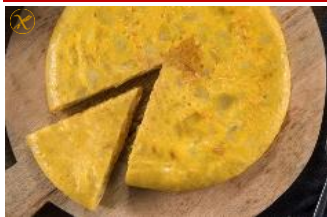
TORTILLA DE PATATA CON CEBOLLA Tortilla de patata con cebolla lista para dorar en sartén SEN-21003 - 1300g - 5u/box