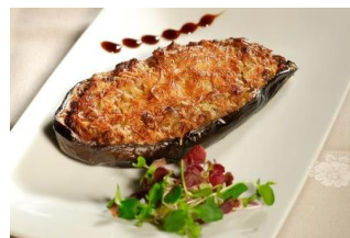
BERENJENA RELLENA Berenjena rellena de carne con queso lista para calentar y servir. BIS-16003 - 250g - 24u/box