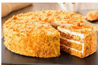
CARROT CAKE & NUECES Bizcocho de zanahoria y nueces recubierto de crema de queso y decorado con bizcocho rallado. DES-80578 – 1500g – 1u/box