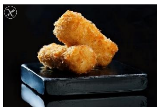
CROQUETAS HORNEABLES SIN GLUTEN JAMÓN IB. - SEN-13615 QUESO AZUL & NUECES - SEN-14005 BACALAO & CEBOLLA - SEN-14006 30g - 32u/b - 128u/box