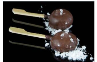
PIRULETA CHOCOLATE & FOIE Piruleta de foie y mermelada de arándanos recubierto de chocolate. EXQ-15004 - 12g - 24u/b - 72u/b