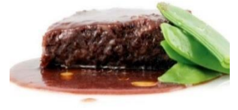
MELOSO DE TERNERA Meloso de ternera ABT deshuesado LINGOTE: BIS-17130 - 170g - 24u/box PLACA: BIS-17031 - 2000g - 3u/box