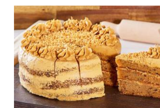
TARTA TURRÓN Suave bizcocho de caramelo relleno de crema de turrón, decorado con turrón y crujiente de cacahuete. DES-80807 – 1900g – 1u/box