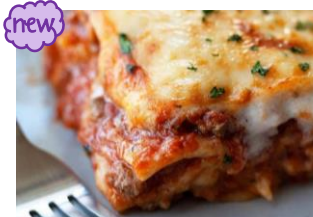
LASAÑA DE CARNE Lasaña rellena de boloñesa de carne de ternera. BIS-14310 - 300g - 12u/box