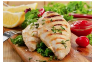
PECHUGA DE POLLO ABT Pechugas de pollo marcadas y cocinadas a baja temperatura BIS-11010 - 1000g - 6u/box