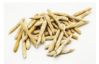
CAÑAS DE PAN FEO Finas barritas de pan hechas a mano, para acompañar quesos y embutidos SOP-01008 - 48u - 500g - 8b/box