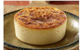
CHEESECAKE SAN SEBASTIÁN Tarta de queso cremosa con toque de vainilla. R: 2h a +4°C TEU-06633 – 95g – 20u/box