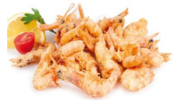
GAMBAS DE SANLÚCAR ENHARINADAS Gambas de Sanlúcar enharinadas CAR-02148 – 3kg/box