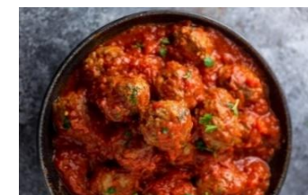
ALBÓNDIGAS TERNERA & NAPOLITANA Albóndigas de ternera con salsa de tomate. BIS-16108 - 220g - 20u/box