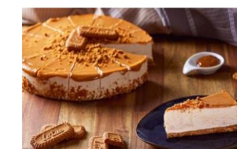
DULCE DE LECHE & LOTUS Base de galleta lotus, cheesecake de queso, decorado con dulce de leche. DES-80930 – 1300g – 1u/box