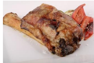
MEDIO CODILLO DE CERDO Medio codillo con hueso ABT BIS-17120 - 300/400g - 16u/box