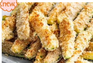
STICKS DE CALABACÍN Paltos de calabacín con parmesano y panko BIS-12025 - 1000g - 5b/box