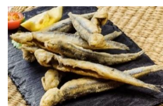
BOQUERÓN LIMPIO Boquerón limpio enharinado CAR-05217 - 4kg/box