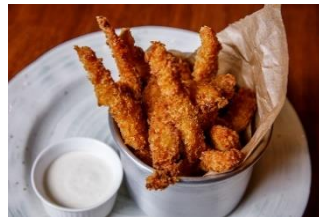
FINGERS DE POLLO CON PANKO Carne de Pollo marinada y rebozada en panko BIS-12020 - 1000g - 5b/box