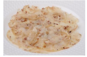
CARPACCIO MANITAS DE CERDO Carpaccio cortado en láminas BIS-14305 - 100g - 30u/box