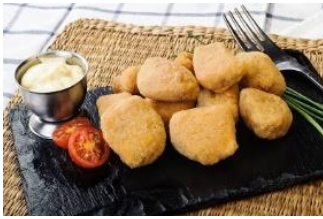
ADOBO Caella en adobo enharinada CAR-05164 – 5g/box