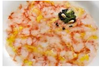
CARPACCIO GAMBA ROJA Carpaccio de gamba roja alistada 100% FUE-14020 - 10u/b - 3b/box