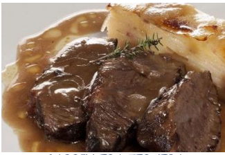
CARRILLERA TERNERA Carne de ternera entera BIS-17031 - 2000g - 6k/b