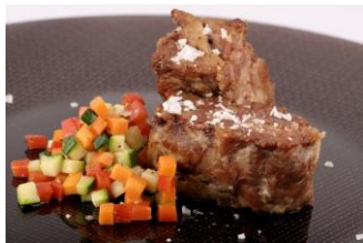
COSTILLA IBÉRICA DESHUESADA Costilla Ibérica ABT deshuesada LINGOTE: BIS-17011 - 170g - 24u/box PLACA: BIS-17035 - 2000g - 3u/box