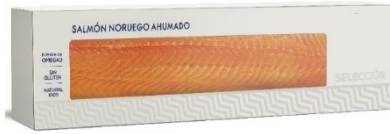
SALMÓN AHUMADO ENTERO PLANCHA Lomo salmón ahumado plancha 1,1 – 1,4kg SAL-M006 - 1400g - 1u/box