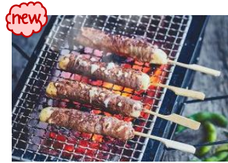
PINCHO YAKI TERNERA & QUESO Pincho de ternera y queso gouda COT-10011 - 40g - 40u/box