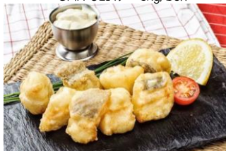
TAQUITOS DE BACALAO Tacos de bacalao enharinados CAR-05212 – 5kg/box