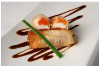
ROLLITO CABRA & TOMATE Rollito queso de cabra y confitura de tomate EXQ-15006 - 18g - 30u/b - 180u/box