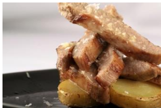
SECRETO DE CERDO IBÉRICO Secreto de cerdo Ibérico ABT RACIÓN: BIS-17027 - 220g - 20u/box GRANEL: BIS-17026 - 1000g - 5u/box