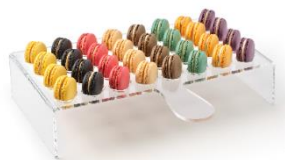
PALETA MACARONS (32 MACARONS) Soporte de metraquilato en formato de paleta de 26,9x33x7cm MAS-DIS110 – 4u/box