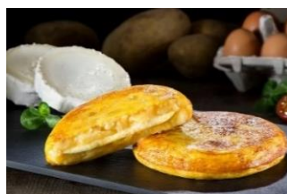
BURGER QUESO DE CABRA Tortilla rellena de queso de cabra para dorar en sartén o tortillero SEN-22011 - 180g - 18u/box