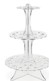
SOPORTE TORRE 48 MINI CONOS Soporte de metraquilato en formato torre para 48 mini conos MAS-DIS108 – 1u/box