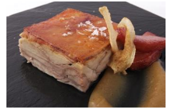
COCHINILLO DESHUESADO Cochinillo confitado a ABT y deshuesado LINGOTE: BIS-17140 - 160g - 24u/b PLACA: 17141 - 2Kg - 3u/b