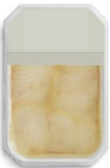
BACALAO AHUMADO EN ACEITE Bacalao ahumado precortado en aceite SAL-A122 - 700g - 2u/box