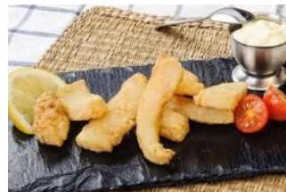
JÍBIA ENHARINADA Tiras de jibia enharinadas CAR-05221 – 4kg/box