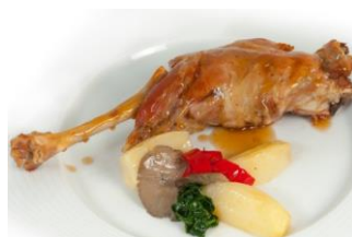
PIERNA LECHAZO CONFITADO Pierna lechazo confitado ABT LAR-21502 - 550g - 8u/box