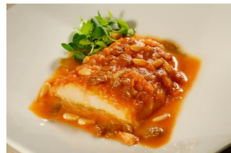
BACALAO CON TOMATE Bacalao con salsa de tomate, piñones y uvas pasas. EXQ-17024 - 250g - 8u/box