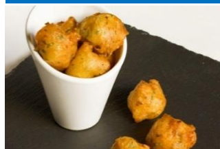
BUÑUELO DE BACALAO Buñuelo de bacalao pre-frito PAI-00286 - 20g - 1000g/b - 6b/box