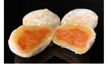
MOCHI DE SOBRASADA Mochi de arroz glutinoso relleno de sobrasada EXQ-15212 - 20g - 48u/b - 144u/b