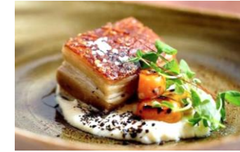
PORK BELLY / PANCETA CERDO ABT Panceta de cerdo ABT BIS-16212 - 500g - 8u/box