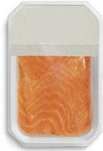
SALMÓN AHUMADO EN ACEITE Salmón ahumado precortado en aceite SAL-A102 - 700g - 2u/box