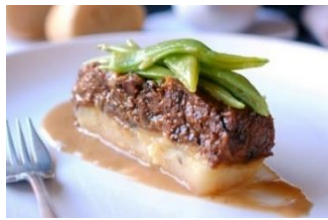
RABO DE TERNERA DESHUESADO Cola de ternera abt deshuesada LINGOTE: BIS-17045 - 170g - 24u/b PLACA: BIS-17046 - 2000g - 3u/b