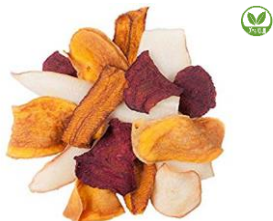
CHIPS VEGETALES Cubo de chips vegetales: batata, remolacha, yuca y zanahoria FLA-19265 - 600g - 6u/box