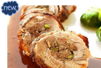
MUSLO POLLO DE CEBOLLA & JAMÓN Muslo de pollo relleno de cebolla caram, jamón, ciruelas y piñones a baja temperatura. BIS-11016 - 250g - 24u/box