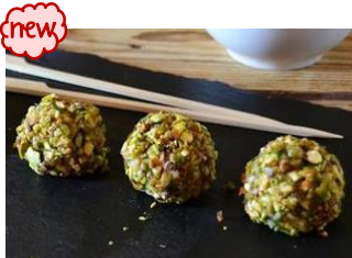
BOMBÓN DE FOIE & PISTACHOS Bombón de foie y membrillo recubierto de pistachos. ATC-15020 - 16g - 90u/b