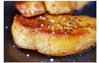
ESCALOPES DE FOIE 25/30g: CHA-04705 – 1000g 40/60g: CHA-04701 – 1000g 4u/b