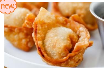
WONTON COCHINITILLO / RABO Wonton relleno de cochinitillo en su jugo o de rabo de toro al vino tinto. COCHI: BIS-11525 - 20g - 140u/b RABO: BIS-11526 - 20g - 140u/b