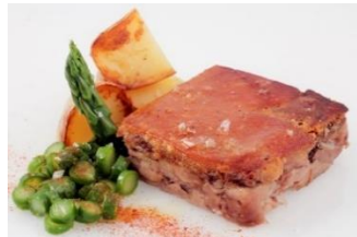
CODILLO DE CERDO DESHUESADO Codillo ABT deshuesado en placa LINGOTE: BIS-17115 - 170g - 24u/box PLACA: BIS-17117 - 2000g - 3u/box