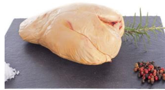
HÍGADO DE PATO FRESCO HÍGADO FRESCO EXTRA: KAT-OHFE – 600/800g – 4u/b HÍGADO FRESCO PRIMERA: KAT-OHF1 – 600/800g – 4u/b