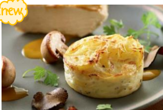
GRATÉN DE PATATA & TRUFA Cuartos de corazones de alcachofa confitada y rebozada con panko TEU-004355 100g - 20u/box