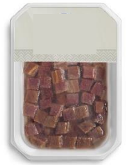
ATÚN AHUMADO DADOS Atún ahumado en dados en aceite SAL-A163 - 700g - 2u/box