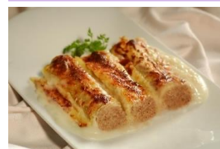
CANELONES CARNE: BIS-14301 - 300g - 12u/b SETAS: BIS-14302 - 300g - 12u/b ESPINACAS: BIS-14303 - 300g - 12u/b