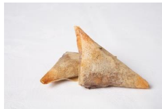
TRIÁNGULO ESPINACAS & BACALAO Brick relleno de espinacas y bacalao EXQ-15008 - 15g - 30u/b - 180u/box