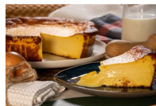
TARTA DE QUESO CREMOSA Tarta cremosa de queso, huevos y nata de La tía Cristina. DES-83801 – 1500g – 1u/box