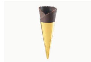
MINI CONO REPOSTERIA Mini cono cacao anhidradura 75x25mm MAS-DIS581 – 75mm – 180u/box