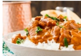
POLLO MASALA Pollo guisado con especies al estilo indio BIS-16114 - 250g - 20u/box