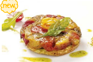
TATIN DE VERDURAS Tatin de verduras provenzales, tomate, pimiento, calabacín y cebolla con tomillo TEU-004356 80g - 18u/box