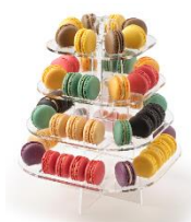
TORRE MACARONS (56 MACARONS) Soporte de metraquilato en forma de torre de 28,5x13cm MAS-DIS110 – 4u/box