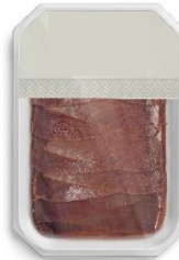
ATÚN AHUMADO EN ACEITE Atún ahumado precortado en aceite SAL-A124 - 700g - 2u/box