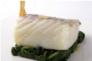
BACALAO CONFITADO Bacalao confitado a baja temperatura aromatizado con ajo SRV-17300 - 180g - 12u/box