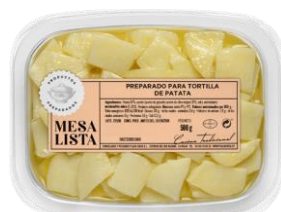
PREPARADO TORTILLA PATATA Patata pochada con cebolla Recomendación tortilla: 100g x 1 huevo Ideal también para guarnición o salteados MES-11210 - 500g - 16u/box