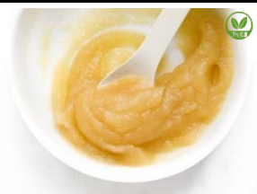
PURÉ MANZANA & CANELA Puré de Manzana con canela BIS-30104 - 250g - 10u/box