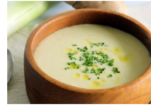
VICHYSOISE Crema de puerros BIS-16023 - 250g - 20u/box