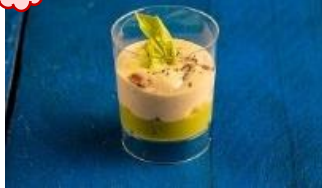
VASITO HUMUS & GUACAMOLE Vasito de hummus y guacamole, pimentón y semillas de sésamo. COC-09037 - 35g - 42u/b - 126u/box