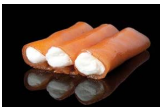
CANELONES MEMBRILLO Canelones de membrillos rellenos de requesón. EXQ-18004 – 50g – 24b/box