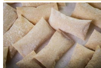
PAN SOPLAO Pan vacío por dentro y crujiente por fuera. Aguanta la humedad y permite rellenar. SOP-01005 - 400g - 3b/box