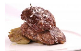
CARRILLERA DE CERDO Carrillera de cerdo a baja temperatura a granel BIS-17029 - 1000g ap. - 6u/box