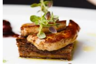
ESCALOPES DE FOIE Descongelar 1 minuto en micro. Dorar en plancha sin aceite. CHA-04701 - 1000g - 4u/b