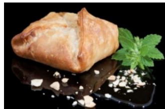
WELLINGTON DE POLLO Hojaldre relleno de carne de pollo, jamón ibérico, ciruelas y almendras. BIS-17827 - 150g - 24u/box