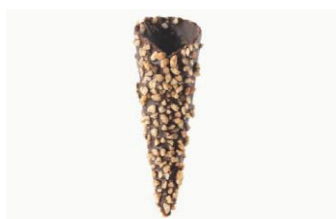
MINI CONO CACAO CROCANTE Mini cono cacao anhidradura con crocanti de 75x25mm MAS-DIS582 – 75mm – 180u/box