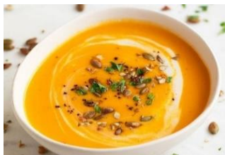
CREMA DE CALABAZA Crema de calabaza BIS-16020 - 250g - 20u/box