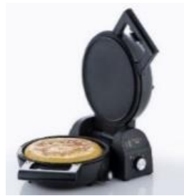
TORTILLERO CHEF Tortillero para elaborar tortilla de 700g. SEN-52000 - 1u/b