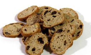
TOSTADAS PASAS & NUECES Crujientes tostadas con pasas y nueces ideales para acompañar aperitivos SOP-01017 - 135g - 10b/box