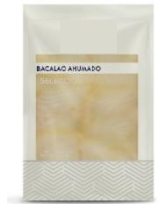
BACALAO AHUMADO SOBRE Bacalao ahumado precortado en sobre SAL-A034 - 100g - 6u/box