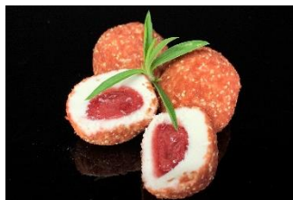
FRESITA DEL BOSQUE CON QUESO Bombón cabra y frambuesa desh. y núcleo de mermelada de frambuesa. EXQ-15053 - 13g - 48u/b - 144u/b