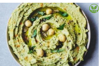
HUMMUS ALBAHACA Hummus de garbanzos con albahaca. BIS-70180 - 1000g - 7u/box