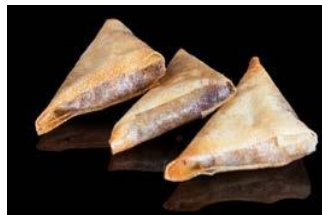
TRIÁNGULO FOIE & MEMBRILLO Brick relleno de foie y membrillo EXQ-15016 - 15g - 30u/b - 180u/box