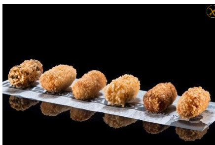
CROQUETAS CRUJIENTES SIN GLUTEN JAMÓN IB. & KIKOS - SEN-14003 PARMESANO & TOMATE - SEN-14004 QUESO AZUL & NUECES - SEN-14005 BACALAO & CEBOLLA CARAMELIZADA SEN-14001 BOLETUS & PATATA - SEN-14002 TRUFA - SEN-14007 SALMON SEN-14008 new! 30g - 32u/b - 128u/box