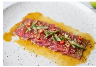
ATÚN AHUMADO EN ACEITE Atún ahumado precortado en aceite SAL-A162 - 700g - 2u/box