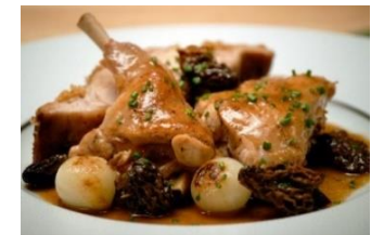
CONEJO AL AJILLO Conejo guisado al ajillo BIS-16111 - 240g - 20b/box