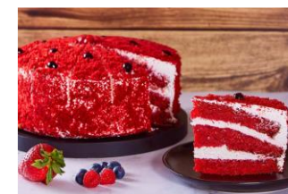
RED VELVET Bizcocho de cacao rojo con mermelada de frutas del bosque y crema de queso, decorado con bizcocho rojo. DES-80586 – 1700g – 1u/box