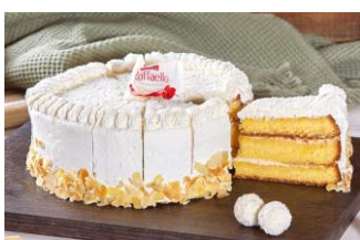
RAFFAELLO DE COCO & CREMA Suave bizcocho relleno de mousse de chocolate blanco y crujiente de coco decorado con almendra y coco. DES-80934 – 1500g – 1u/box