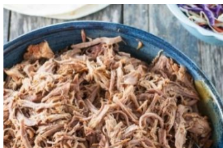
PULLED PORK / CERDO Carne de cerdo desmigada BIS-11091 - 500g - 20u/box