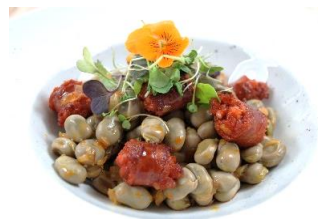
HABITAS CON CHISTORRA Habitas baby con cebolla y chistorra. BIS-16073 - 300g - 20u/box