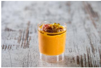
VASITO SALMOREJO Vasito de salmorejo con aceite y virutas de jamón ib. COC-09036 - 35g - 42u/b - 126u/box