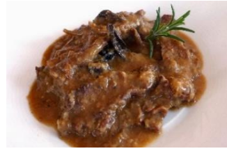
FRICANDÓ CON SETAS Ternera guisada con setas BIS-16110 - 250g - 20u/box