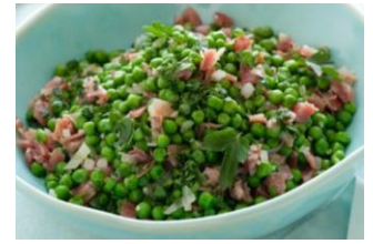
GUISANTES CON JAMÓN Guisantes salteados con jamón EXQ-16030 - 250g - 20u/box