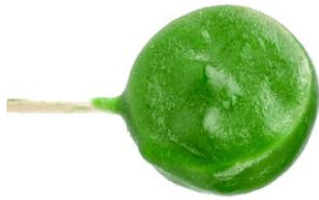
PIRULETA FOIE & MANZANA Piruleta de foie recubierta de mermelada de manzana verde. ATC-15031 - 14g - 40u/b