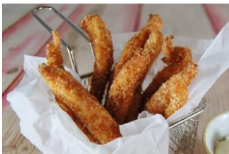
CHICKEN TENDERS CON PANKO Pechuga de Pollo marinada y rebozada en panko BIS-12015 - 1000g - 5b/box