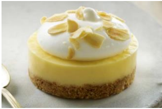
SABLÉ LIMÓN & MERENGUE Crumble de almendra, crema de limón, merengue italiano y almendras en láminas. TEU-04787 – 90g – 16u/box