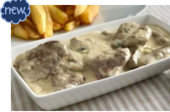
ESCALOPINES AL QUESO AZÚL Escalopes de carne de cerdo con salsa de queso azul. BIS-11017 - 250g - 20u/box