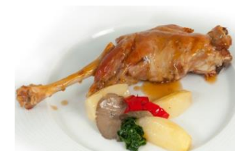
PIERNA DE CABRITO Pierna de Cabrito a baja temperatura LAR-41502 - 450g - 8u/box