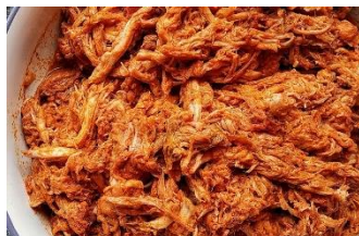
PULLED COCHINITA PIBIL Carne de cerdo desmigada al pibil BIS-11072 - 1000g - 10u/box